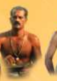
ഇടത്താളം ശ്രീ പാഴ്ക്കാട് നാണു