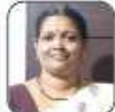
കുറ്റിപ്പുഴ വടക്കൻ നമ്പൂരിപ്പിള്ളി