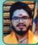
കിഴിപ്പാലം പാലക്കാട് മുരുകുട്ടൻ