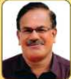
ഡോ. പി. (എം.) എ. സങ്കരനാരായണൻ പ്രസിഡന്റ്