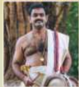
വിനോദ്. ഇ. ചാക്രaborty