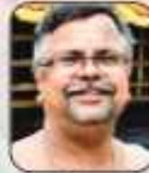
കിഴിപ്പാലം കിഴിപ്പാലം വടക്കൻ നമ്പൂരിപ്പിള്ളി