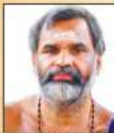
വേലം ശ്രീ പെരുവനം സെപ്റ്റംബർ