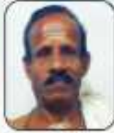
കുറ്റിപ്പുഴ കുറ്റിപ്പുഴ വടക്കൻ നമ്പൂരിപ്പിള്ളി