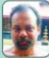
കിഴിപ്പാലം കുറ്റിപ്പുഴ വടക്കൻ നമ്പൂരിപ്പിള്ളി