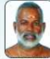
കിഴിപ്പാലം മുറ്റത്തുപുഴ വടക്കൻ നമ്പൂരിപ്പിള്ളി