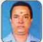
കുറ്റിപ്പുഴ വടക്കൻ നമ്പൂരിപ്പിള്ളി