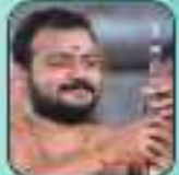
കുറ്റിപ്പുഴ വടക്കൻ നമ്പൂരിപ്പിള്ളി