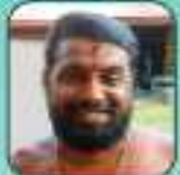
കുറ്റിപ്പുഴ വടക്കൻ നമ്പൂരിപ്പിള്ളി