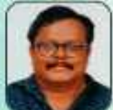
കുറ്റിപ്പുഴ വടക്കൻ നമ്പൂരിപ്പിള്ളി