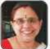
കുറ്റിപ്പുഴ വടക്കൻ നമ്പൂരിപ്പിള്ളി