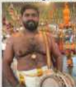
യജ്. എസ്. ചാക്രaborty