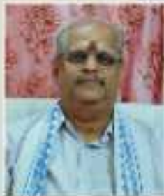
ഡോ. സി. പത്മജനൻ