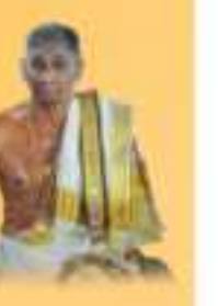
ഇടത്ക്ക ശ്രീ തിരുവിലവാല മരൻ