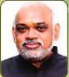
മി. സങ്കട് സെക്രട്ടറി