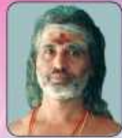
കേശവൻ കുറ്റിപ്പുഴ കേശവൻകുട്ടി കുറുപ്പൻ