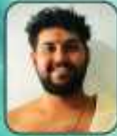
കിഴിപ്പാലം കുറ്റിപ്പുഴ വടക്കൻ നമ്പൂരിപ്പിള്ളി