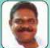
കുറ്റിപ്പുഴ വടക്കൻ നമ്പൂരിപ്പിള്ളി